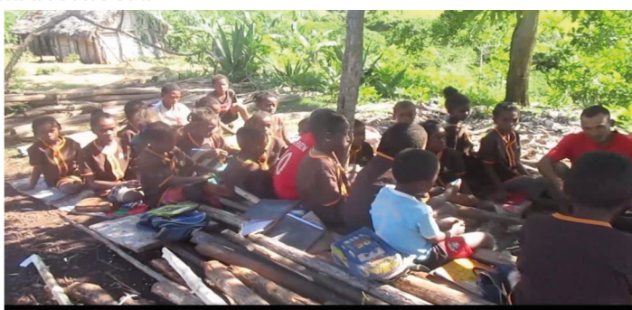
avant / après...