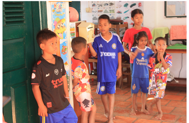
Enfants du centre de Siem Raep 2