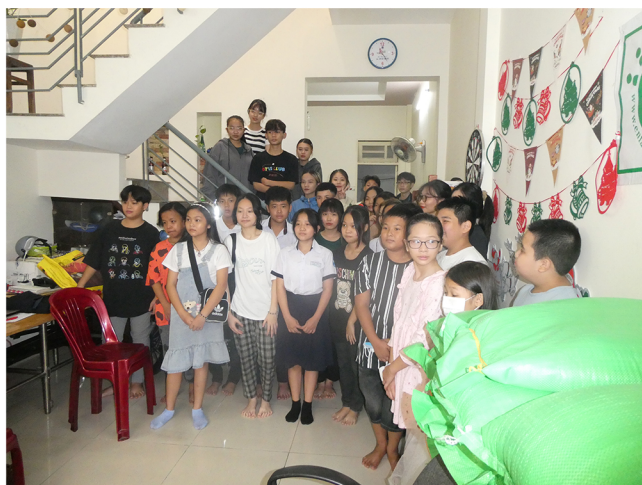
Distribution de paniers alimentaires aux classes d'Amour