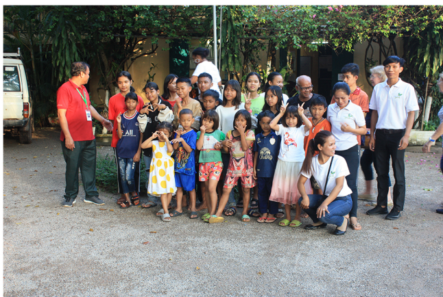
Enfants du centre de Siem Raep 2

Nous voulons améliorer les conditions de vie des 40 enfants accueillis dans le centre de protection infantile de Siem Raep 2.