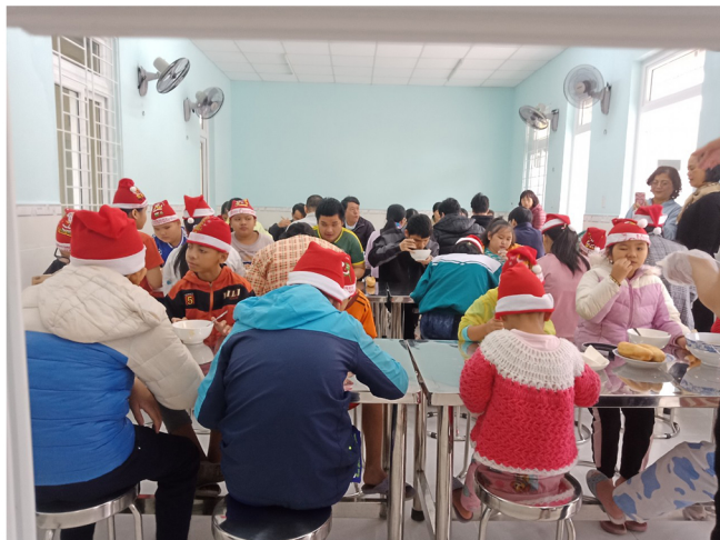
Gouter de Noël dans le nouveau réfectoire

C'est une belle réussite: le Repas de Noël pour 60 enfants a pu avoir lieu peu de temps après notre visite.