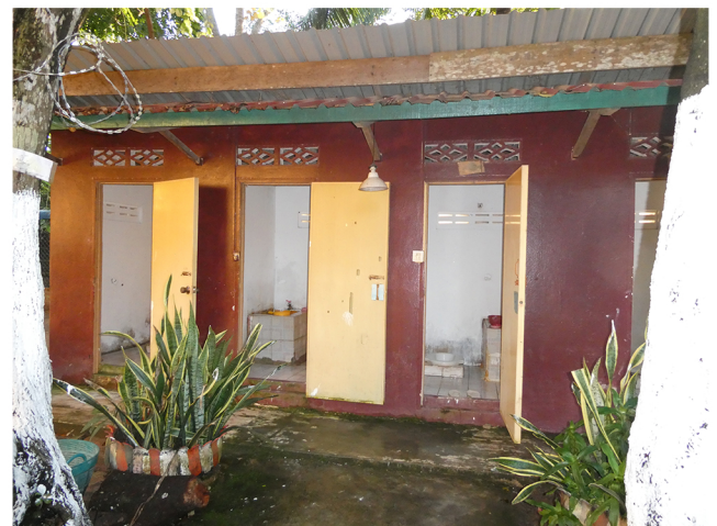
Latrines du centre de Siem Raep 2