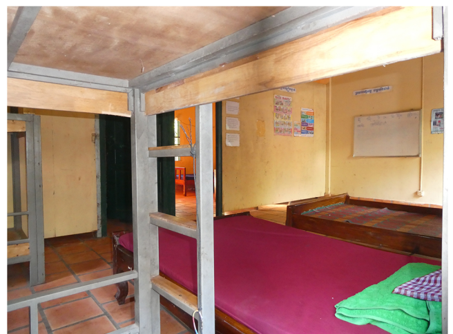
Dortoirs du centre de Siem Raep 2