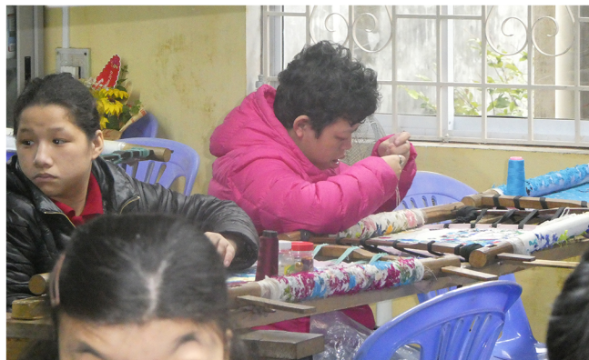
Le centre des jeunes handicapés

Et c'est la fin d'un voyage riche en émotion et qui nous conforte sur le bien-fondé de nos actions .