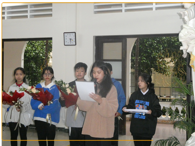
Discours de remerciements à Hué Mékong

Cette rencontre très émouvante s'est clôturée par un beau discours lu par une filleule.